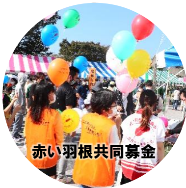
赤い羽根共同募金