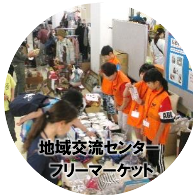
地域交流センター フリーマーケット