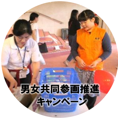
男女共同参画推進 キャンペーン